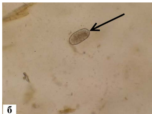
Рис. 1. Яйця дикроцелій (а) і шлунково-кишкових стронгілят (б). Зб. х 150