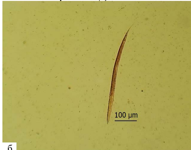
Рис. 2. Інвазійні личинки роду Haemonchus (а) і Bunostomum (б)