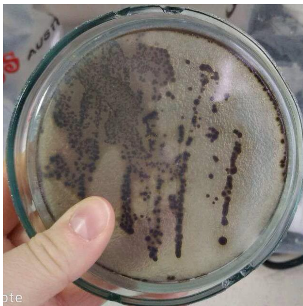
Рис. 1. Ріст сальмонел на вісмут-сульфіт агарі

При посіві на вісмут-сульфіт агар отримали найбільш характерний ріст сальмонел. Колонії мали правильну округлу форму. Вони були яскраво-чорного кольору, дрібні, блискучі. При стиранні шпателем колонії, у товщі вісмут-сульфіт агару залишався чорний пігмент (рис. 1).