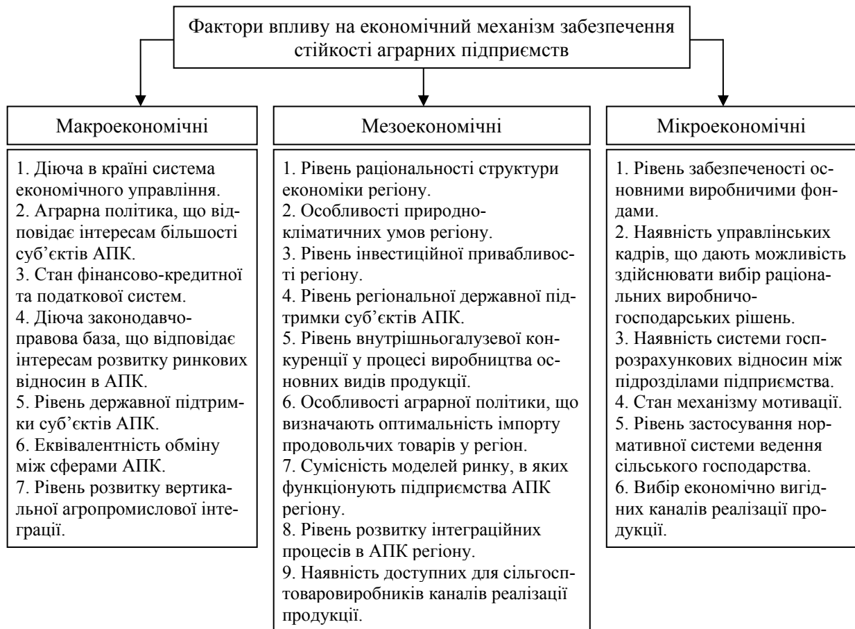
Рис. 1. Фактори впливу на економічний механізм забезпечення стійкості

ють досягнення стратегічних і тактичних цілей у конкретні проміжки часу й забезпечуються відповідністю параметрів і результатів перебігу внутрішньогосподарських процесів змінним умовам зовнішнього середовища.